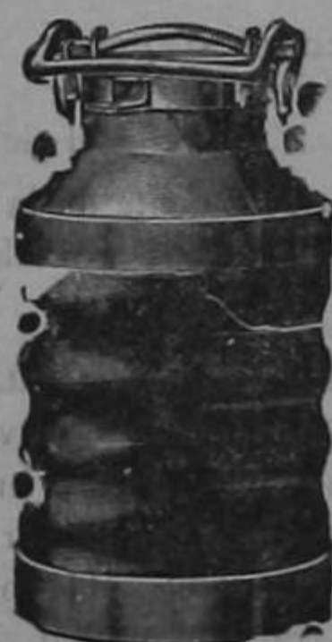
Almacenes al por mayor